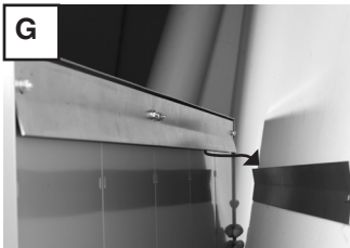
Anlage einhängen. *Abstandshalter je nach Verkleidung unterschiedlich