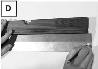
Die demontierte Montageleiste an der Wand ausrichten, Bohrlöcher anzeichnen.