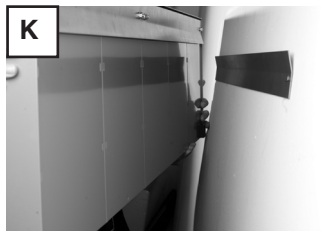
Anlage wieder einhängen.