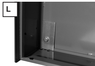
Anlage unten mit mitgelieferter Montageplatte festschrauben.