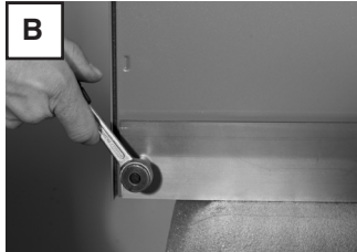
Die untere Montageleiste abschrauben.