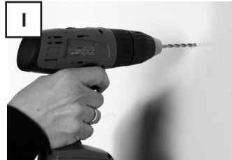
Bohrungen entsprechend den Hinweisen der Dübelhersteller vornehmen. Dübel in Bohrlöcher stecken.