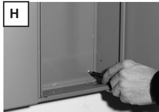
Untere Türen öffnen. Bohrlöcher unten anzeichnen. Anlage aushängen.