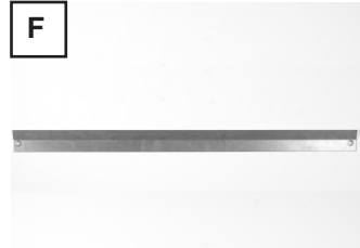
Montageleiste festschrauben. Schrauben und Dübel je nach Untergrund und Anlagengewicht verwenden (bauseits!).